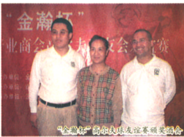
“金瀚杯”高尔夫球友谊赛颁奖酒会

第五届住交会展览设有城市规划、房地产展区、房地产营销策划展区、建筑规划设计等部分，集合了房地产业产业链上的建筑、设计、规划、代理等多个行业，集中了中国优秀的房地产及其相关行业，吸引了国内外通千家企业参展，数千个新项目、新