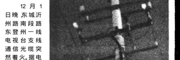
12月1日晚,东城沂州路南段路东登台一线电视台支通信光缆突然着火。据电力抢修部门人士说可能是用户产生熔断器碰撞火花脱落引起。但没有造成人员伤亡及财产损失。

广饶讯 近年来,广饶县以塑造现代化城市形象为目标,以营造优美和谐人居环境为宗旨,按照“大环境、大绿化、大生态、大人性化”的城市园林绿化建设思路,突出抓好优化城市生态、建设,努力创建城市、生态环境、人居三者和谐的“绿色家园”。近日,该县通过了省人居环境专家组的评审验收,被授予了“山东人居环境范例奖”荣誉称号。(魏海霞 徐红梅)