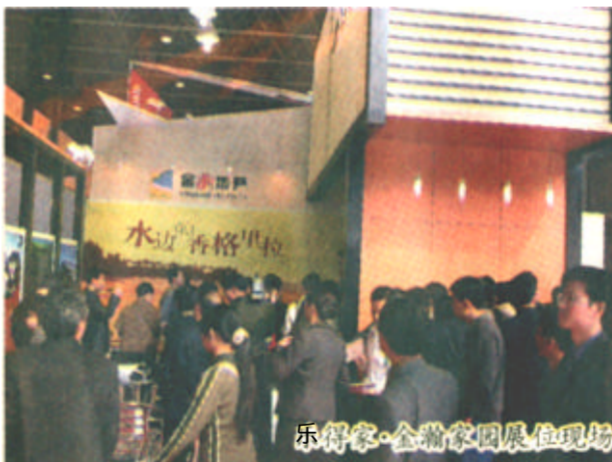
乐得家·金瀚家园展位现场