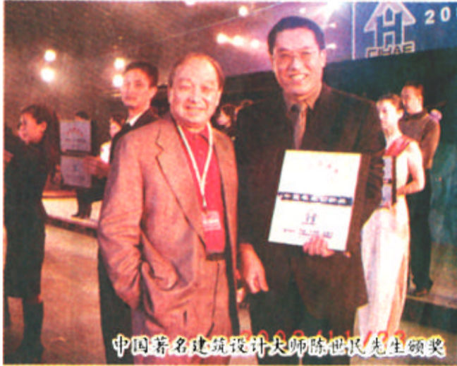
中国著名建筑设计大师陈世民先生颁奖

是一个绵延不断的过程，不能中断和割裂，因此可持续发展是人类自身的一种内在需求。乐得家·金瀚家园的开发，以“造景增值、城市运营”的清风湖开发模式为先导，以新都市主义理念为主线贯穿整个开发过程。在建设过程中，金瀚家园与清风湖公园相互借景、互动开发，使清风湖公园与金瀚家园地段成为全市的旅游“热点”，增强了东营城市的活力，提高了东营城市的人居质量，改善了东营城市生态环境，从而促进了东营城市的可持续发展。