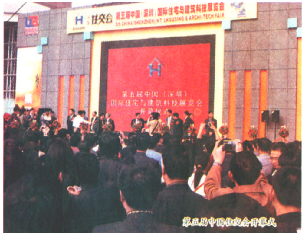
第五届中国住交会开幕式

技术、新产品、新材料及诸多中国最高水准的地产品牌登台亮相，真正搭建了一个品牌展示、品牌竞争、品牌演进、品牌创新的平台，实现住宅产业企业的大规模交流互动，国际和国内的跨区域联动。