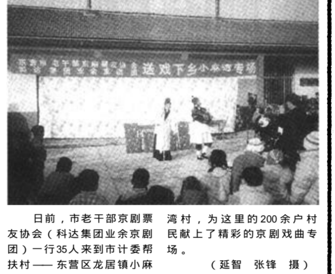
日前,市老干部京剧票友协会(科达集团业余京剧团)一行35人来到市计委帮扶村——东营区龙居镇小麻湾村,为这里的200余户村民献上精彩的京剧戏曲专场。

本报讯 日前,利津县北岭乡台村李胜平来到北岭派出所,将一面写有“人民的保护神”的锦旗送到所长手中,感激之情无以言表。 事情是这样的,11月21日12时许,李胜平的叔叔李庆年老汉在自己家门口遇到一辆白色外地小车,车上下来一个人,热情地与其打招呼,并问这里的玉米、小麦等价格如何,老李问他是哪里,他说是在潍坊外贸运输的,经常外出运粮食、机器零件等到这里,并指着刚从车上下来的另一个说:“这就是我们的孙队长!”好客的老李将他们三人让到家中,经过一番“亲切”地交谈,孙队长要和老李交个朋友,并说以后每次运货路过此地时,都要给老李卸点货,只按半价收款,让其赚点钱。老李喜滋滋的心里暗想:今天可遇“财神”了。临走时,“孙队长”对老李说:我们车上现在还有30盘防水电线,可以给你留下,你只拿2600元钱就行了。”为了与“朋友”做好活今后的生意,老李满口答应后,先将货收下,然后又把家中仅有的2000元钱递给“孙队长”手中。差着的600元,又领着他们到哥哥家借上付清。“孙队长”等三人接过钱便慌忙上车走了。哥哥向弟弟询问了事情的来龙去脉后,觉得事有蹊跷,便立刻向派出所报了警。北岭派出所迅速出击,在几名出租车司机群众的配合下,民警联手在胜利黄河大桥以北将诈骗人员抓获。 经审查,此三人(孙某、赵某、孙某某)均为潍坊市人,以2600元钱卖给老李的防水电线原来是花600元钱在网上买的假电缆,根本就不能用。当老李在派出所接过追回的那2600元现金时,激动得热泪盈眶,感慨万千。(陈建恩)